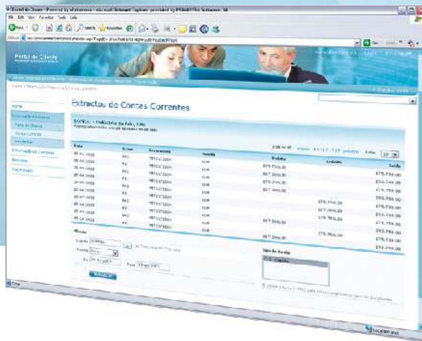
PORTAL DO CLIENTE